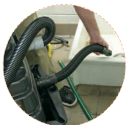
Furtun de golire

În 2012 Kaivac a primit distincția pentru Inovații de Bucătărie a Asociației Naționale de Restaurante din SUA.