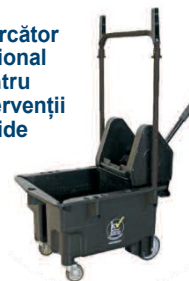
Storcător opțional pentru intervenții rapide